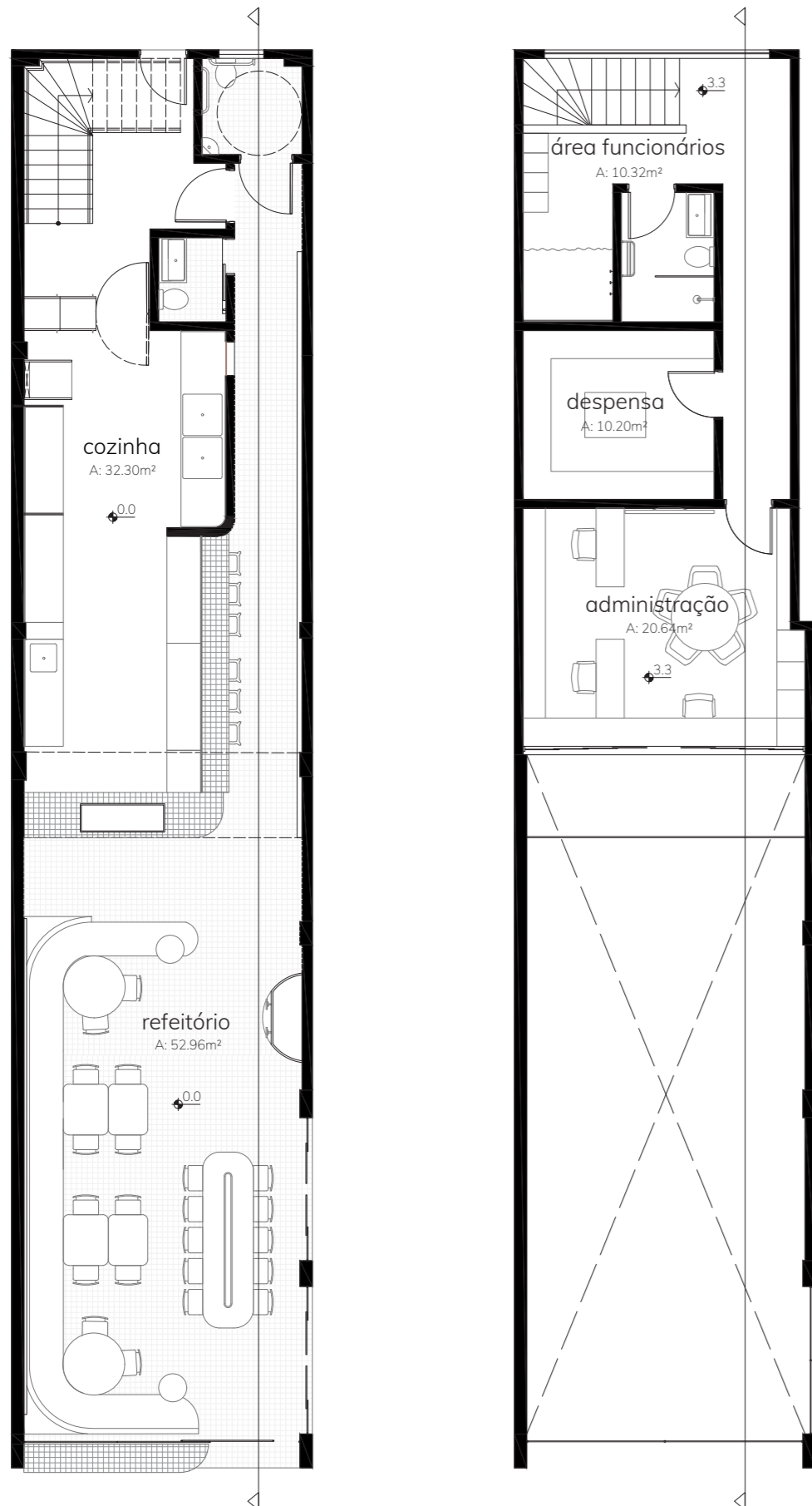
planta baixa térreo escala gráfica