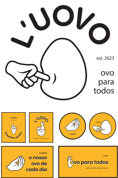
design gráfico logotipo e identidade visual