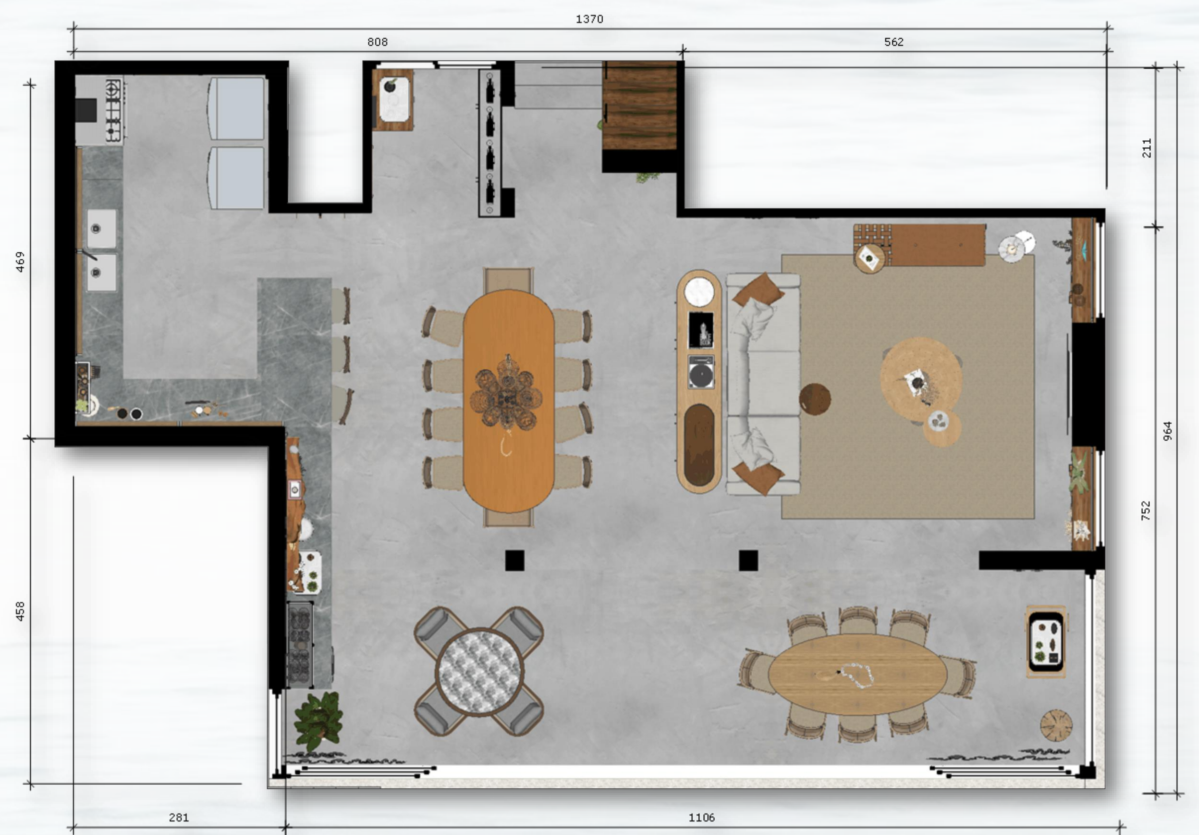
PLANTA BAIXA- ESCALA: 1/50

Fazer a arte através da arquitetura é um conjunto da razão e sensibilidade e a Casa Mar traduz em essência a beleza e a sofisticação da simplicidade.