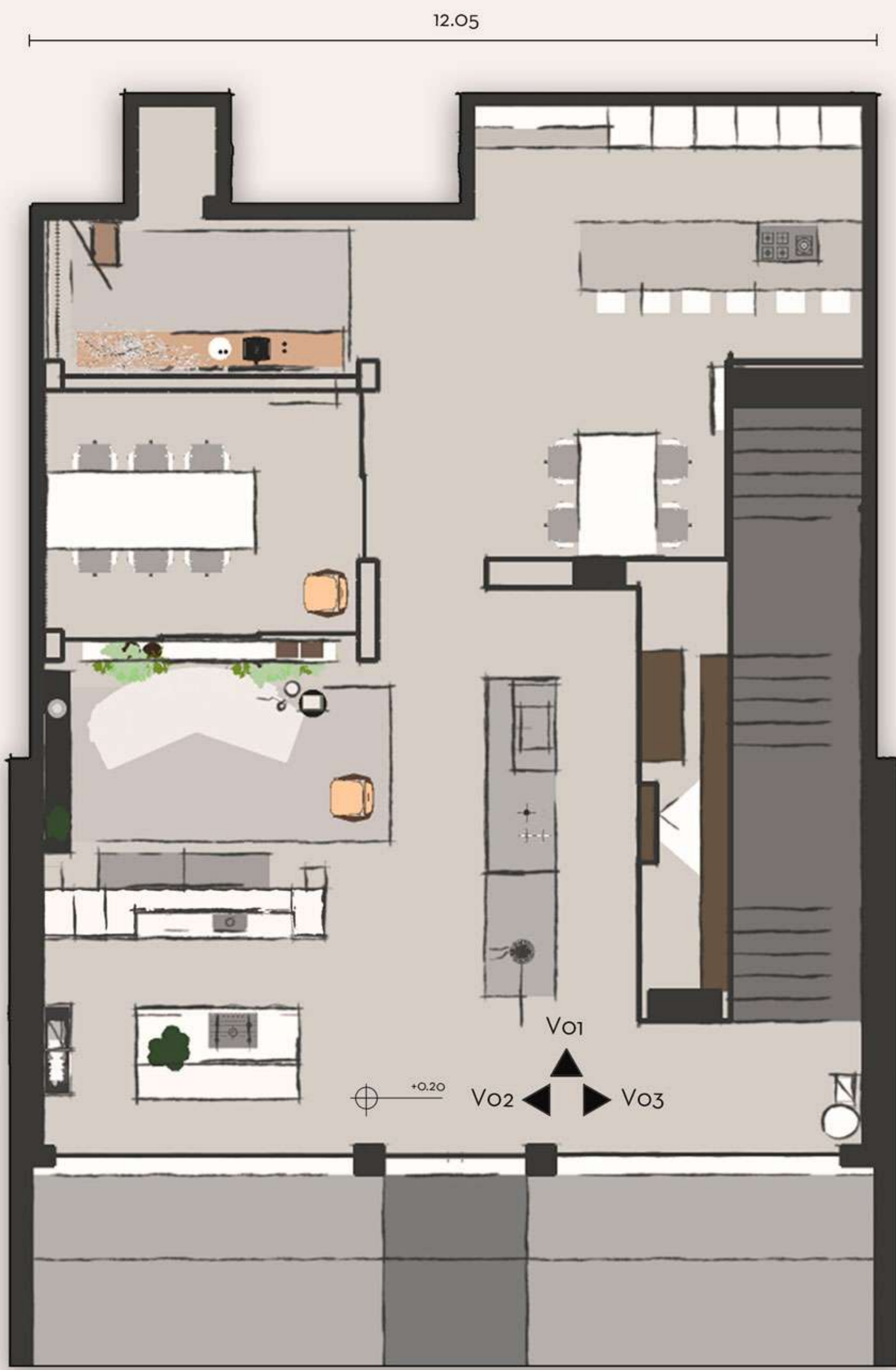
PLANTA BAIXA PAVIMENTO TÉRREO